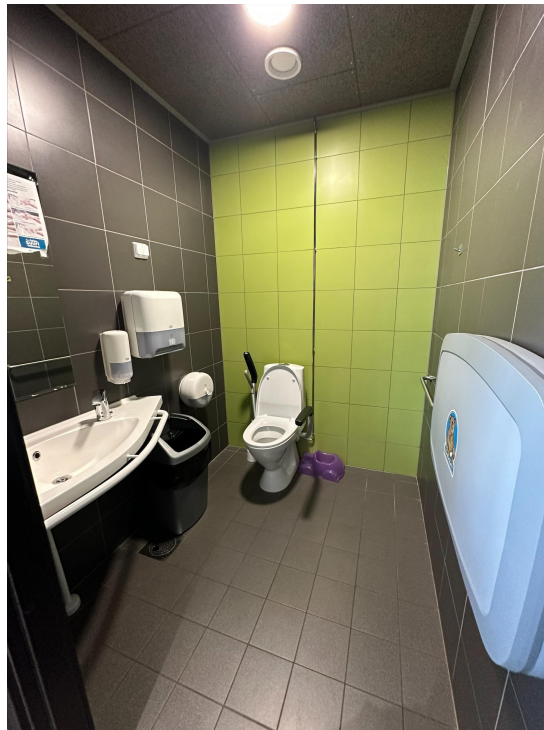
Hesburgerin inva wc on mallikelpoinen

Pääkirjaston automaattisesti avautuvat ovet koettiin todella hyväksi ja niitä pitäisi hyödyntää muissakin kohteissa.