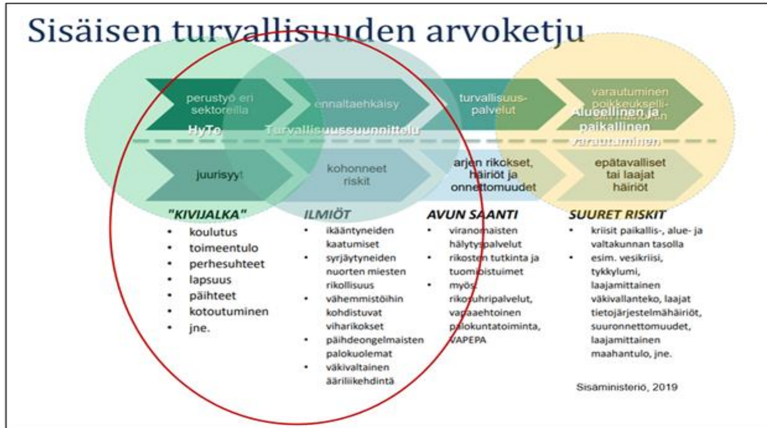
Kuva: Sisäisen turvallisuuden arvoketju ja turvallisuussuunnittelun liittymäpinta hyvinvointi- ja terveystyöhön, Sisäministeriö, 2019